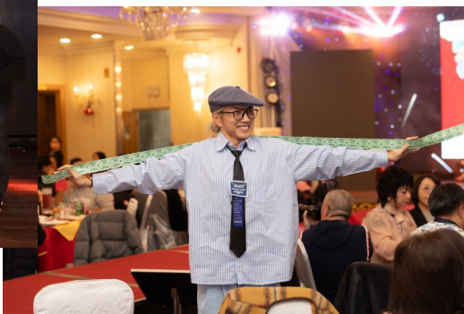
▼ 來賓於晚宴中購買抽獎卷