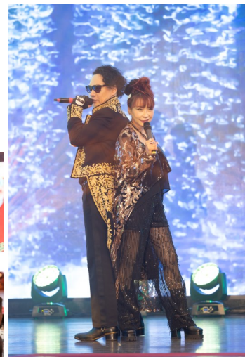
▲ 香港著名歌手蘇姍與表演嘉賓馮家俊